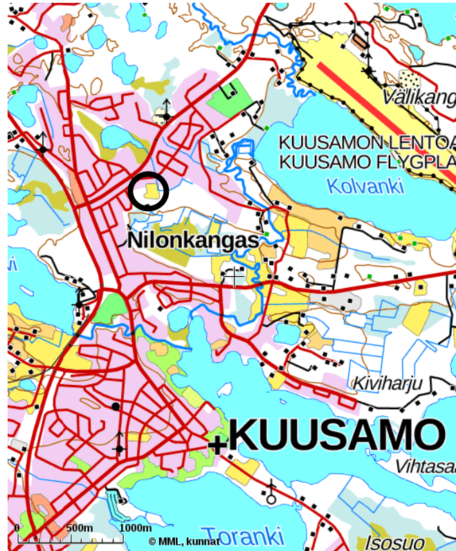
Suunnittelualueen yleissijainti mustalla rajauksella.

Asemakaavan muutos ja laajennus koskee seuraavia kiinteistöjä MAIKKULA 305-411-204-127, LAUTTAOJA 305-411-204-17, KANKKULA 305-411-204-19, KAIVOLA 305-411-204-21, NIITTY 305-411-204-23, TUOPPILA 305-411-204-24, LOHELA 305-411-205-1. Lisäksi asemakaavan muutos ja laajennus koskee kiinteistöjä LAAKSO 305-411-204-4, SUOJALA 305-411-204-5, SIVULA 305-411-204-6 ja LAUTTALA 305-411-489-1.