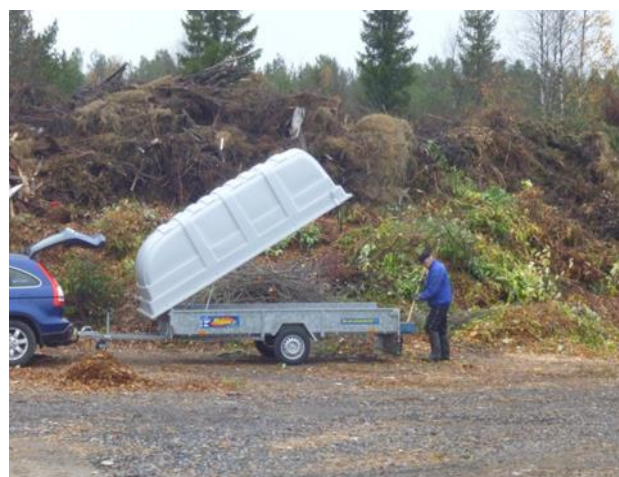
Kolmantena vaihtoehtona on käyttää jäte energiana. Risut ja puutarhajätteet hyödynnetään.