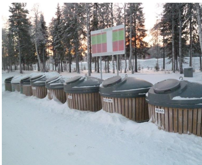
Prisman kierrätyspiste, Huoparintie 1.

Kierrätyspisteistä vastaa Suomen Pakkauskierätys RINKI Oy .