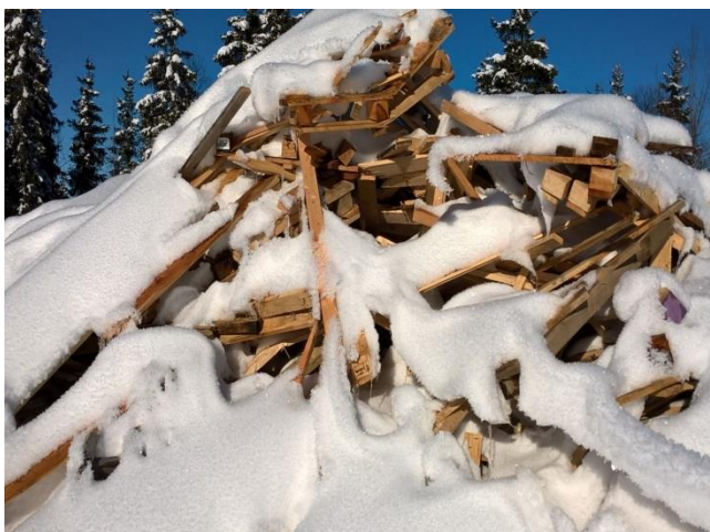
Kotitalouksista ja yrityksistä tuleva lajiteltu jätetpuu kerätään kasaan jäteasemalla.