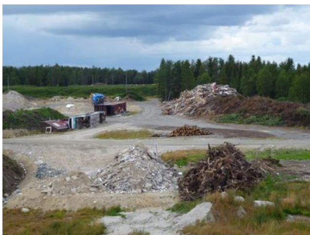
Jäte on pyrittävä hyödyntämään ensisijaisesti käyttämällä uudelleen. Betoni murskataan ja hyödynnetään jäteaseman omissa maanrakennustöissä.