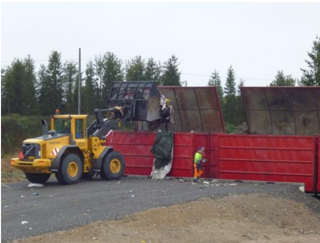
Polttokelpoista jätettä lastataan Oulun ekovoimalaitokseen lähtevään kuljetukseen.

Muistathan, että jätteiden omatoiminen polttaminen kotona tai nuotiossa on kielletty!