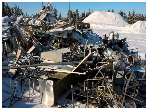
Toissijaisesti jäte hyödynnetään kierrättämällä. Metalliromu menee jatkokäsittelyyn uudelleen hyödynnettäväksi.

Jäte täytyy hyödyntää, jos se on teknisesti mahdollista ja jos siitä ei aiheudu kohtuuttomia lisäkustannuksia verrattuna muulla tavoin järjestettyyn jätehuoltoon.