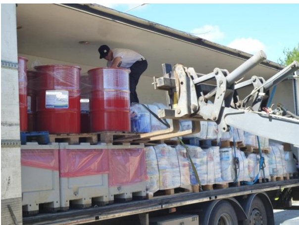
Vaarallisten jätteiden lastaus ja kuljetus jatkokäsittelyyn ongelmajätelaitokseen