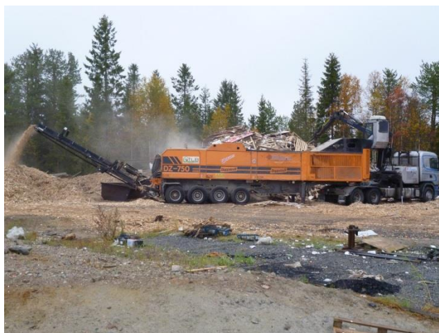
Jätetpuu murskataan ja murskattu puujäte käytetään hyödyksi lämpöenergiana.